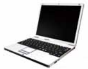
Outlook Web App

社外からは、Web ブラウザ経由で Outlook にアクセスできます。社内と変わらない画面を自宅や持ち出し PC からでも安全にご利用いただけます。もちろん、共有の PC でもセキュリティレベルは下げません。